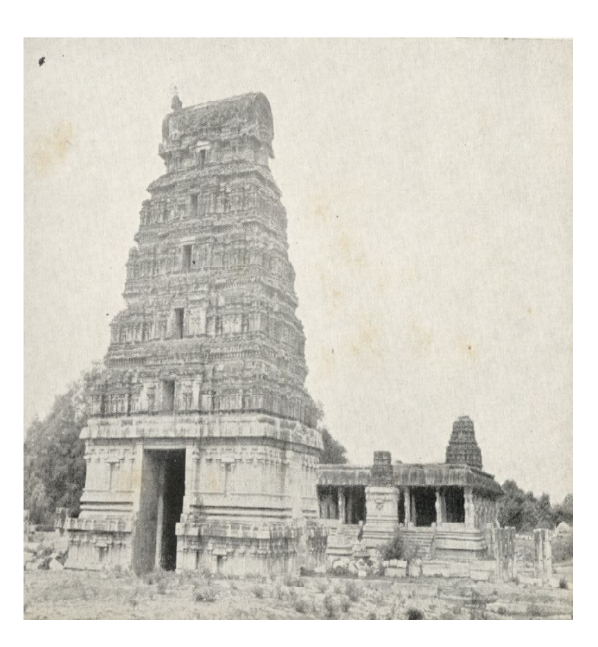
శ్రీ కల్యాణ వేంకటేశ్వరస్వామివారి ఆలయం 1950 సంవత్సరం

ఇదిగో! ఆనాడు 1940 జూలై 11వ తేదీ నాటి నుండి ప్రతిఏటా ఆషాధశుద్ధ శుద్ధసప్తమినాడు "సాక్షాత్కార వైభవం" పేరుతో ఘనంగా శ్రీనివాసమంగాపురంలోని శ్రీకల్యాణవేంకటేశ్వరునికి ఒక్క రోజు ఉత్సవం జరుపబడుతుండేది.