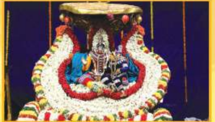
ಅಭಯಕ್ಷಮಾಹನದಲ್ಲಿ ಶ್ರೀ ಶಾಮಾಕ್ಷಿ ಕವಿಲೇಪ್ಪರ ಸ್ವಾಮಿಯವರು