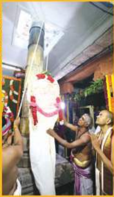
ಶ್ರೀ ಕವಿಲೇಪ್ಪರ ಸ್ವಾಮಿಯವರ ಅಂಯದಲ್ಲು ಧ್ವಜಾರೋಹಣ

ಭದ್ರವರಿ 25 ರಿಂದ ಮಾರ್ಚ್ 06 ರ ವರೆಗೆ ತಿರುಪತಿ ಕವಿಲೇಪ್ಪರಲ್ಲಿ ಶ್ರೀ ಕವಿಲೇಪ್ಪರ ಸ್ವಾಮಿಯವರಿಗೆ ನಡೆದ ವಾರ್ಷಿಕ ಟ್ರಸ್ಟೋತ್ಸವದ ದೃಶ್ಯಮಾಲಿಕೆ