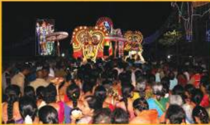
ಆಧಿಶಾಹನಂದಿ ವಾಹನದಲ್ಲಿ ಶ್ರೀ ಕವಿಲೇಪ್ಪರ ಸ್ವಾಮಿಯವರು, ಶಾಮಧೇನುವಿನ ಮೇಲೆ ಶ್ರೀ ಶಾಮಾಕ್ಷಿ ಆರಾಧನೆಯು