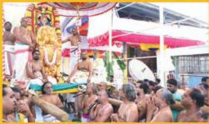
ಸಂವತ್ಸಾರದಲ್ಲಿ ಶ್ರೀ ಕಲ್ಯಾಣ ಚಂಕಟೇಶ್ವರ ಸ್ವಾಮಿಯವರು

ಫೆಬ್ರವರಿ 24 ರಿಂದ ಮಾರ್ಚ್ 04 ರ ವರೆಗೆ ಶ್ರೀನಿವಾಸಮಂಗಾಪುರದಲ್ಲಿ ಶ್ರೀ ಕಲ್ಯಾಣಚಂಕಟೇಶ್ವರ ಸ್ವಾಮಿಯವರಿಗೆ ತಿ.ತಿ.ದೇ., ನಿರ್ವಹಿಸಿದ ವಾರ್ಷಿಕ ಬ್ರಹ್ಮೋತ್ಸವದ ದೃಶ್ಯಮಾಲಿಕೆ