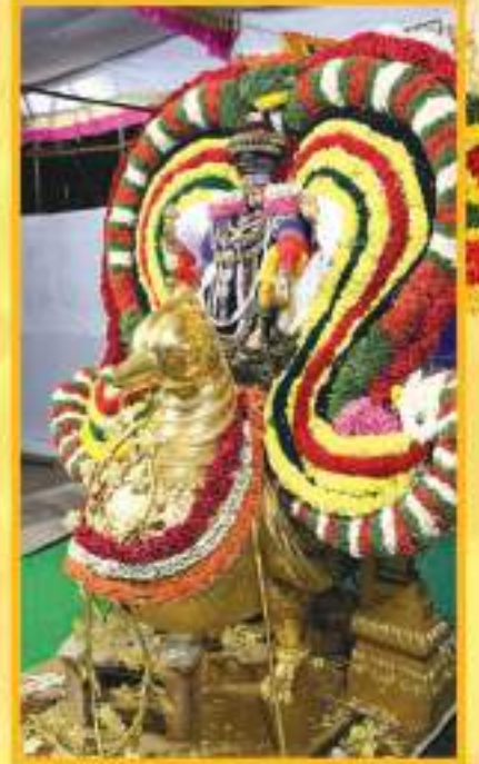
ಹಂಸವಾಹನದಲ್ಲಿ ಶ್ರೀ ಕವಿಲೇಪ್ಪರ ಸ್ವಾಮಿಯವರು

ಭದ್ರವರಿ 25 ರಿಂದ ಮಾರ್ಚ್ 06 ರ ವರೆಗೆ ತಿರುಪತಿ ಕವಿಲೇಪ್ಪರಲ್ಲಿ ಶ್ರೀ ಕವಿಲೇಪ್ಪರ ಸ್ವಾಮಿಯವರಿಗೆ ನಡೆದ ವಾರ್ಷಿಕ ಟ್ರಸ್ಟೋತ್ಸವದ ದೃಶ್ಯಮಾಲಿಕೆ