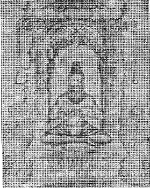
ஸ்ரீ சிவப்பிரகாச சுவாமிகள்