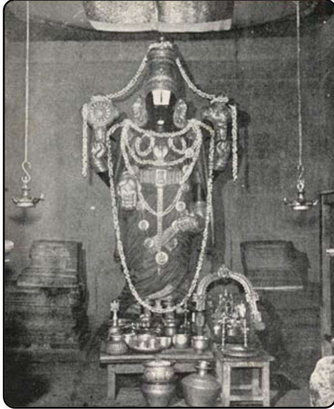
శ్రీకల్యాణవేంకటేశ్వరస్వామి శ్రీనివాసమంగాపురం (1970)

శ్రీనివాసుడు తిరుమలకొండ మీదే కాక, కొండకింద కూడా సాక్షాత్కరించాడంట!