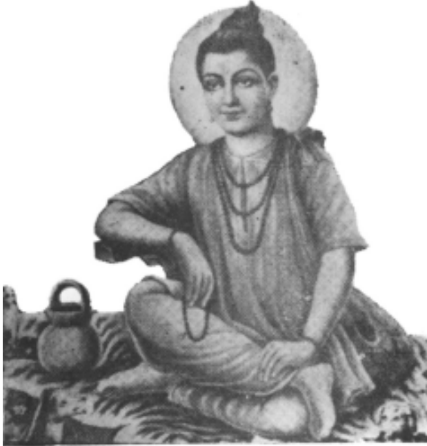
శ్రీ పాద శ్రీ వల్లభులు

ఈ కలియుగంలోనే శ్రీ దత్తాత్రేయస్వామివారు శ్రీపాదశ్రీవల్లభుడు పేరుతో గోదావరితీరంలోని పీఠికాపురంలో (శక్తిపీఠం) అవతరించారు. శ్రీపాదులవారు శ్రీశైలంలోని పాతాళగంగలో అనుష్ఠానం చేసుకొంటూ