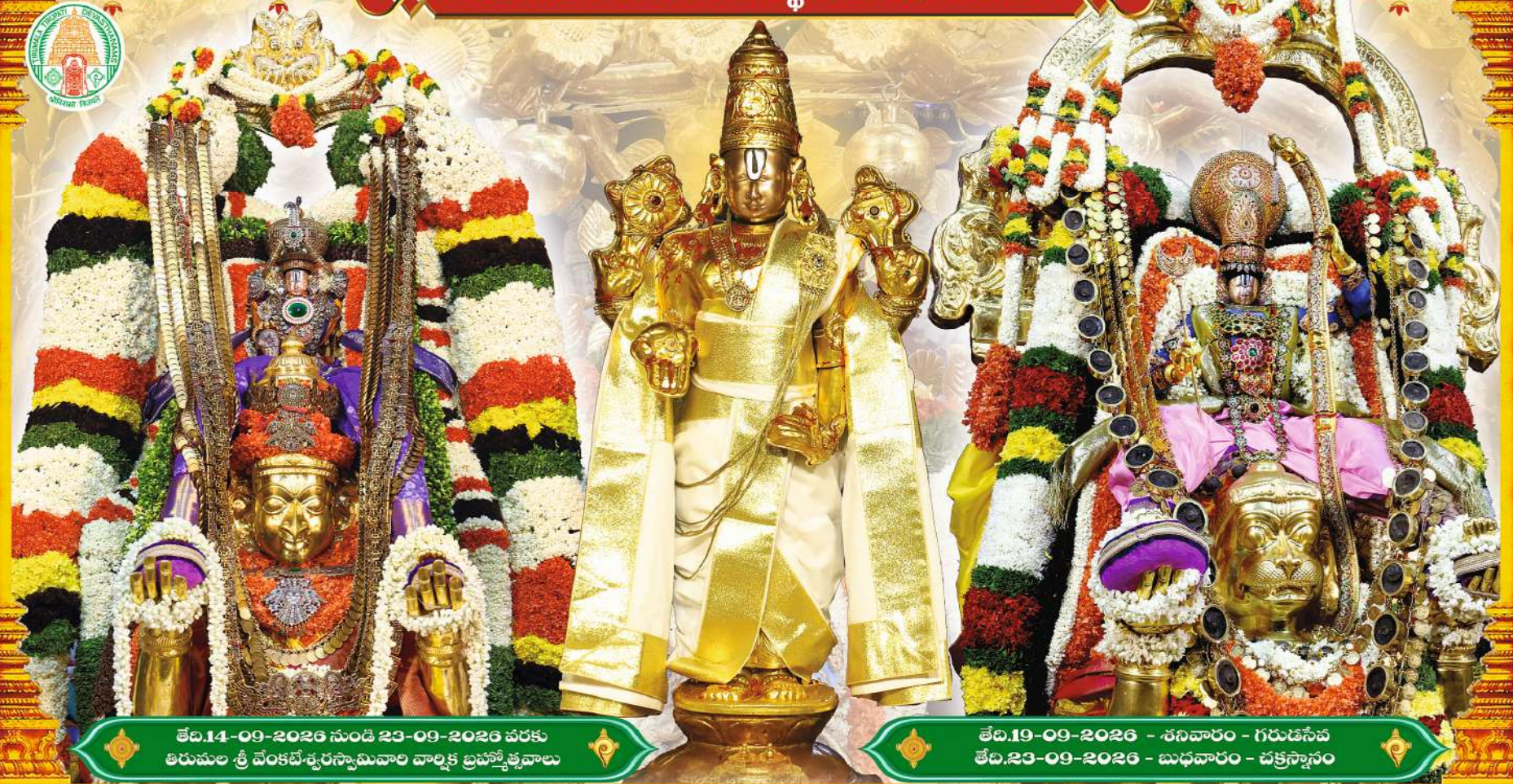
తేది.14-09-2026 నుండి 23-09-2026 వరకు తిరుమల శ్రీ వేంకటేశ్వరస్వామివారి వార్షిక బ్రహ్మోత్సవాలు