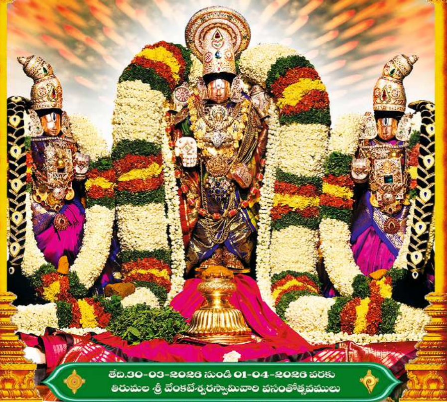
తేది.౦౩-౦౩-౨౦౨౬ నుండి 01-04-౨౦౨౬ వరకు తిరుమల శ్రీ వేంకటేశ్వరస్వామివారి వసంతోత్సవములు