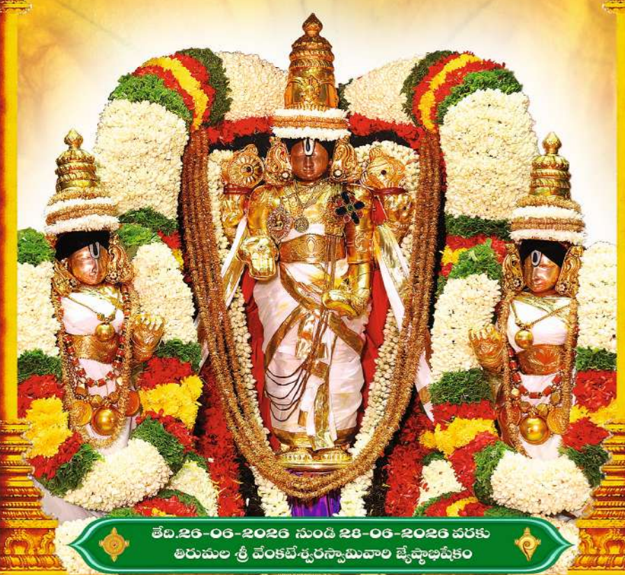
తేది 26-06-2026 నుండి 28-06-2026 వరకు తిరుమల శ్రీ వేంకటేశ్వరస్వామివారి జ్యేష్ఠాభిషేకం

స్వస్తి శ్రీ చాంద్రమాన శ్రీ పరాభవ నామ సం॥ర అధిక జ్యేష్ఠ బహుళ పాడ్యమి సోమవారం నుండి నిజ జ్యేష్ఠ బహుళ పాడ్యమి మంగళవారం వరకు