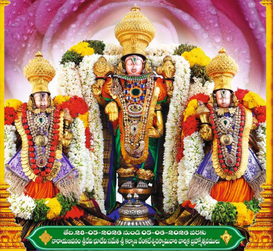
తేది 28-05-2026 నుండి 05-06-2026 వరకు నారాయణవనం శ్రీవేది భూదేవి సమేత శ్రీ కళ్యాణ వేంకటేశ్వరస్వామివారి ధార్మిక బ్రహ్మోత్సవములు