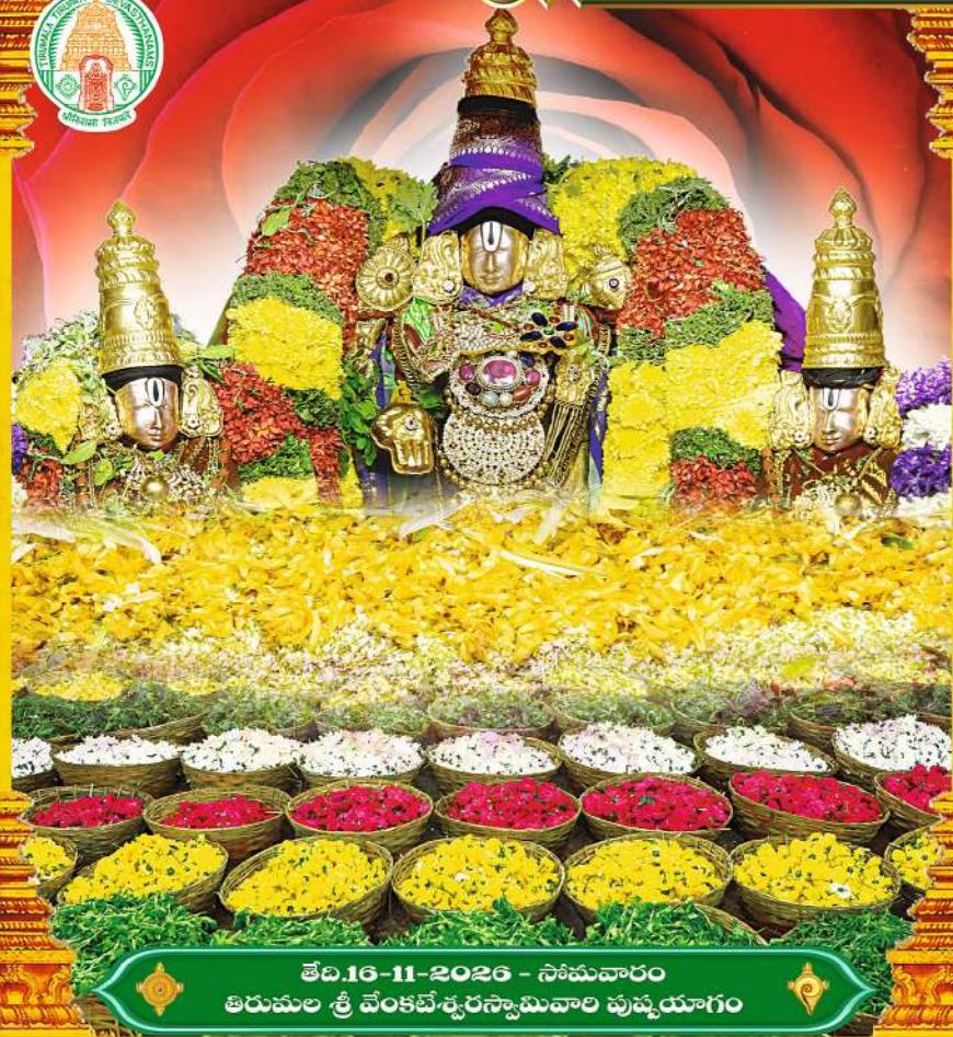
తేది.16-11-2026 - సోమవారం తిరుమల శ్రీ వేంకటేశ్వరస్వామివారి పుష్కరయాగం