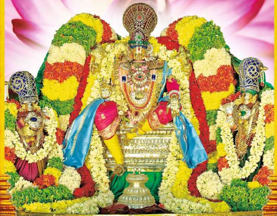
తే.25-06-2026 నుండి 03-07-2026 వరకు అప్పలాయగుంట్ల శ్రీ ప్రసన్న వేంకటేశ్వరస్వామివారి వార్షిక బ్రహ్మోత్సవములు