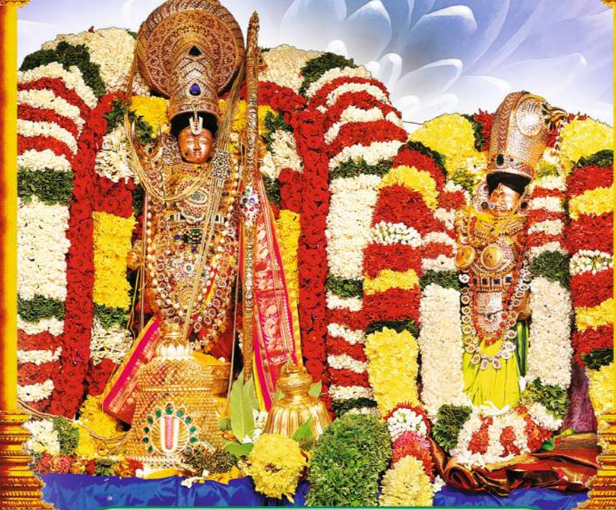
తేది.29-03-2026 నుండి 03-04-2026 వరకు ఓంబీడు శ్రీ కోదండరామస్వామి శ్రీరామనవమి బ్రహ్మోత్సవములు తేది.31-03-2026 - ఓంబీడు శ్రీ కోదండరామస్వామివారి కళ్యాణోత్సవము

స్వస్తిశ్రీ బాండ్రమాన శ్రీ విశ్వావసు నామ సం॥ ఫాల్గుణ శుద్ధ త్రయోదశి ఆదివారం నుండి శ్రీ పరాభవ నామ సం॥ర చైత్ర శుద్ధ త్రయోదశి మంగళవారం వరకు