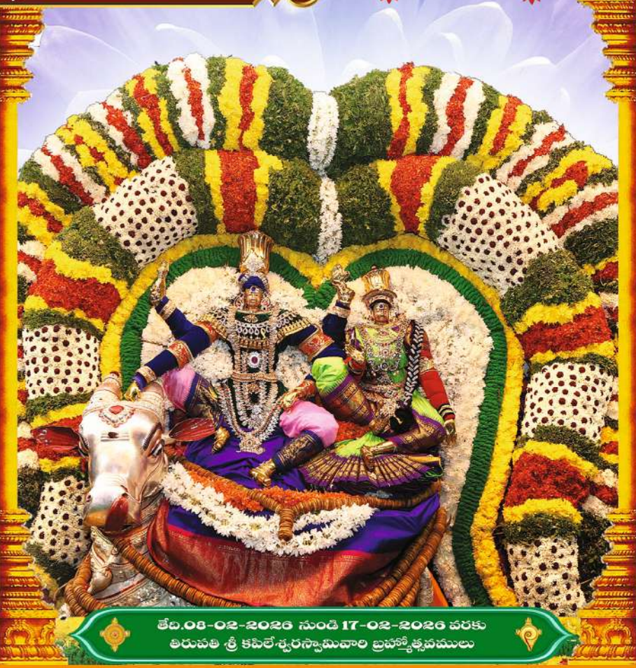
తే.08-02-2026 నుండి 17-02-2026 వరకు తిరుపతి శ్రీ కవితేశ్వరస్వామివారి బ్రహ్మోత్సవములు

స్వస్తిశ్రీ చాంద్రమాన శ్రీ విశ్వావసు నామ సం॥ మాఘ శుద్ధ పూర్ణిమ ఆదివారం నుండి ఫాల్గుణ శుద్ధ ద్వాదశి శనివారం వరకు