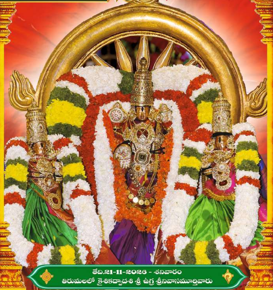
తేది.21-11-2026 - శనివారం తిరుమలలో కై-కికద్వాదశి శ్రీ ఉగ్ర శ్రీనివాసములైవారు

స్వస్తిశ్రీ చాంద్రమాన శ్రీ పరాభవ నామ సం॥౮ ఆశ్వయుజ బహుక సప్తమి ఆదివారం నుండి కార్తీక బహుక సప్తమి సోమవారం వరకు