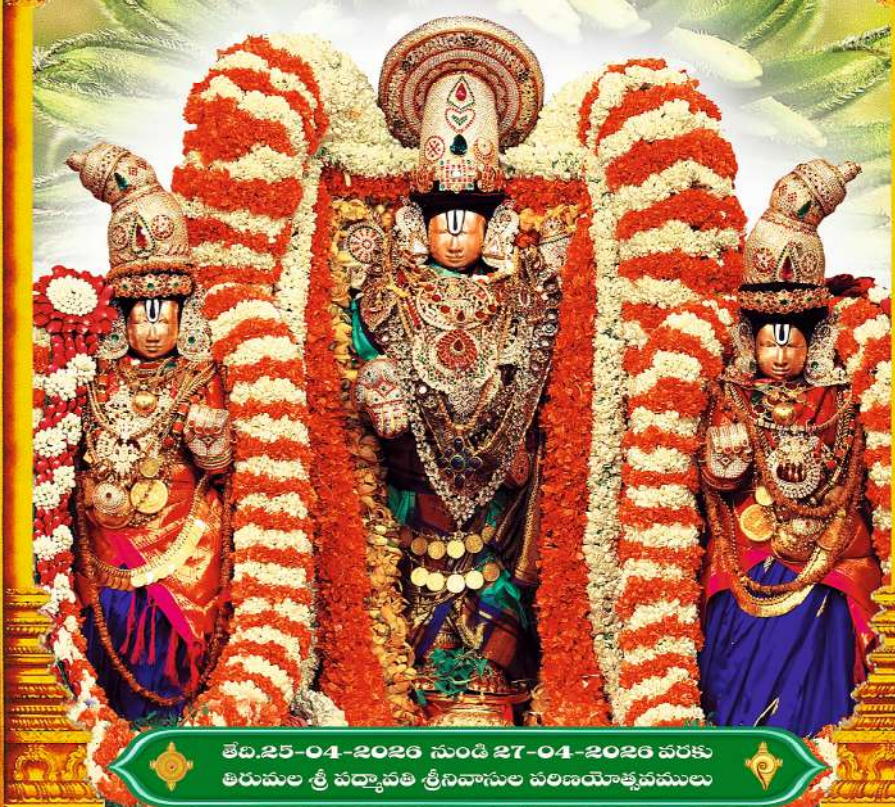
తేది.౨5-04-౨౦౨౬ నుండి 27-04-౨౦౨౬ వరకు తిరుమల శ్రీ వద్వావతి శ్రీనివాసుల చరిత్రాయోత్సవములు

స్వస్తిశ్రీ చాంద్రమాన శ్రీ పరాభవ నామ సం॥౨॥ చైత్ర శుద్ధ చతుర్దశి బుధవారం నుండి వైశాఖ శుద్ధ చతుర్దశి గురువారం వరకు