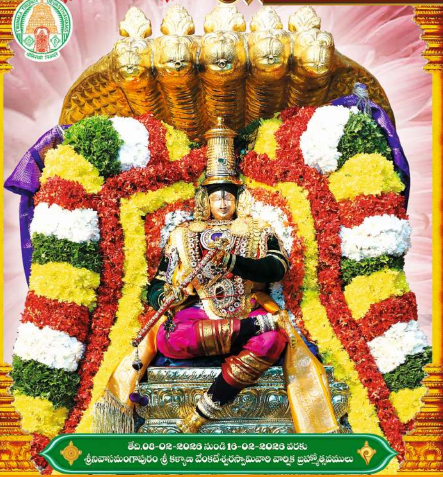
తే.08-02-2026 నుండి 16-02-2026 వరకు శ్రీనివాసమంగాపురం శ్రీ కళ్యాణ వేంకటేశ్వరస్వామివారి వార్షిక బ్రహ్మోత్సవములు