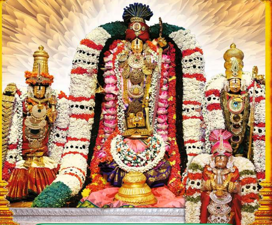
తేది.17-03-2026 నుండి 25-03-2026 వరకు తిరుపతి శ్రీ కోదండరామస్వామివారి బ్రహ్మోత్సవములు