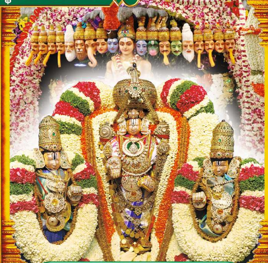
తే.17-07-2026 - శుక్రవారం తిరుమలలో ఆణివార ఆస్థానం, పుష్యబిక్షి

స్వస్తి శ్రీ చాంద్రమాన శ్రీ పరాభవ నామ సం॥ర నిజ జ్యేష్ఠ పాడ్యమి గురువారం నుండి ఆషాఢ బహుళ ఏదియ శుక్రవారం వరకు